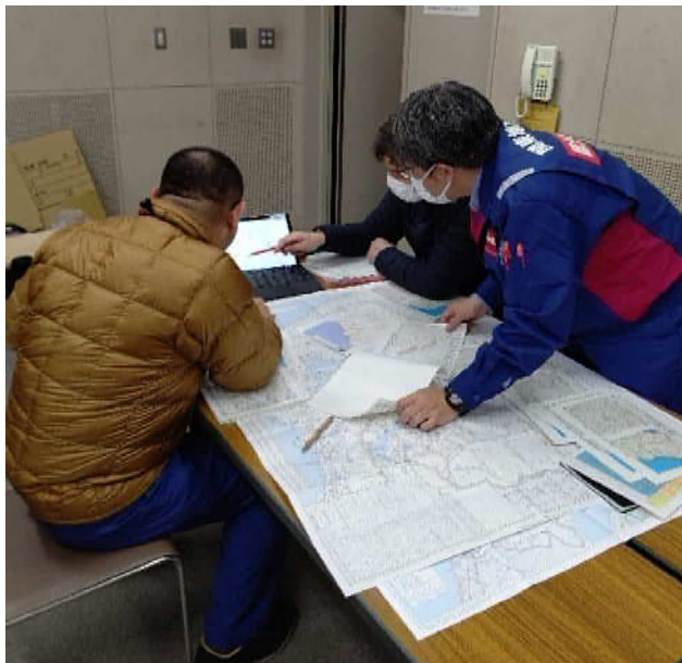
(活動拠点での資料作成状況)