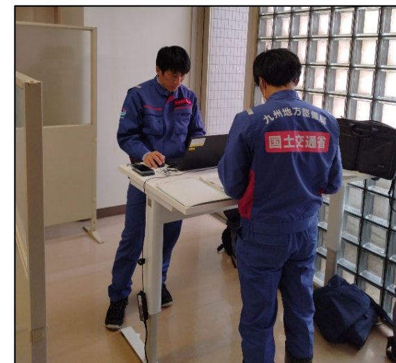
▲打ち合わせ状況 （高度技術指導班（水道））