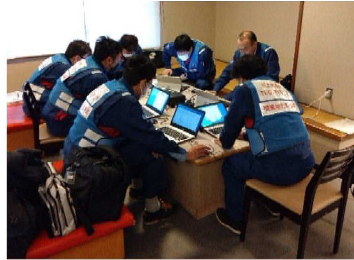
(活動拠点での資料作成状況)