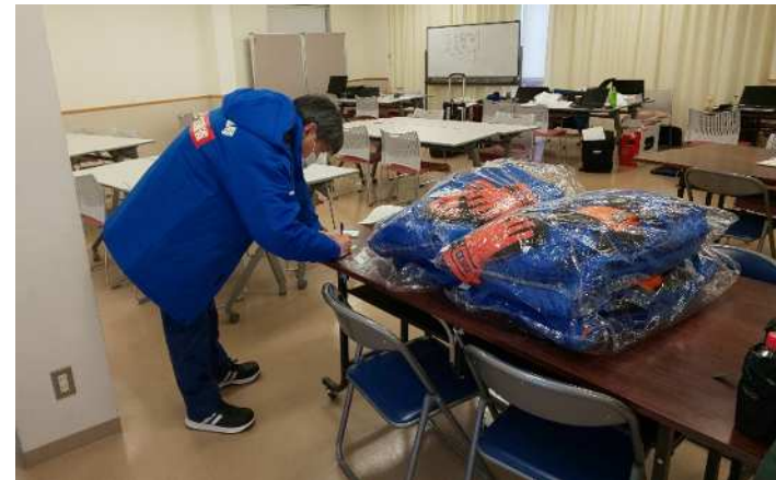
(活動拠点での支援活動の状況)