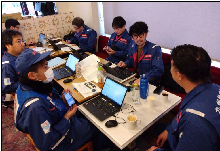
▲打ち合わせ状況（被災状況調査班（道路））