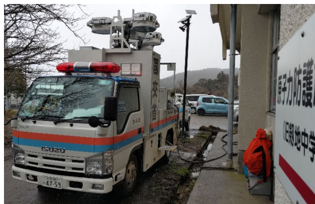
【電源支援班】輪島市、珠洲市他 作業状況(23日)