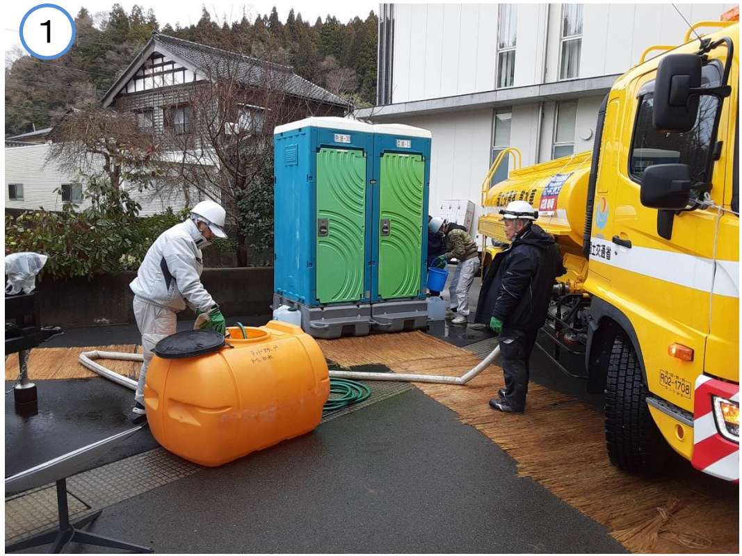
給水活動（能登町役場）