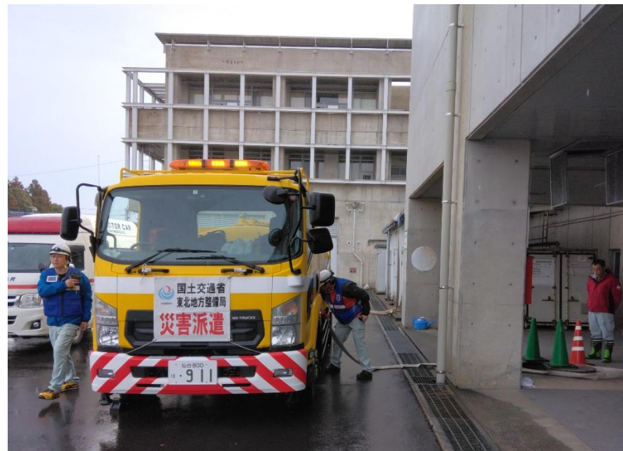
珠洲市総合病院での給水支援状況