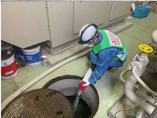
散水車による活動状況(給水支援)(珠洲市内)