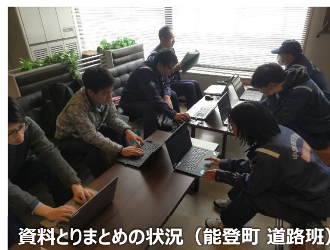
資料とりまとめの状況（能登町 道路班）