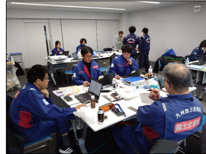
▲打ち合わせ状況 （被災状況調査班（海岸））