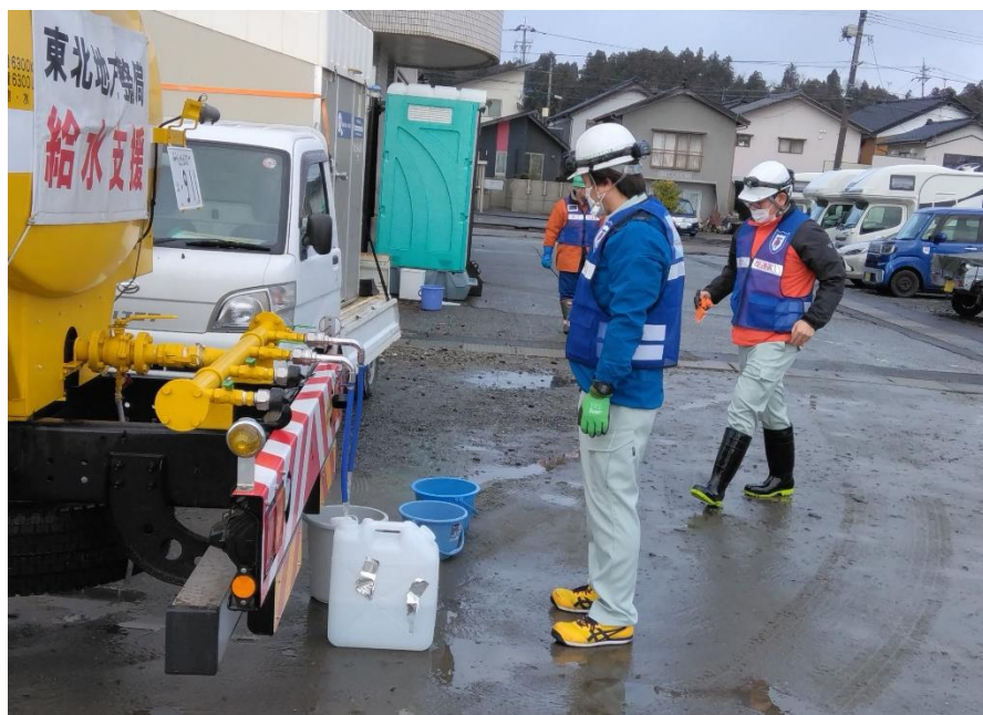
珠洲商工会議所への給水支援状況