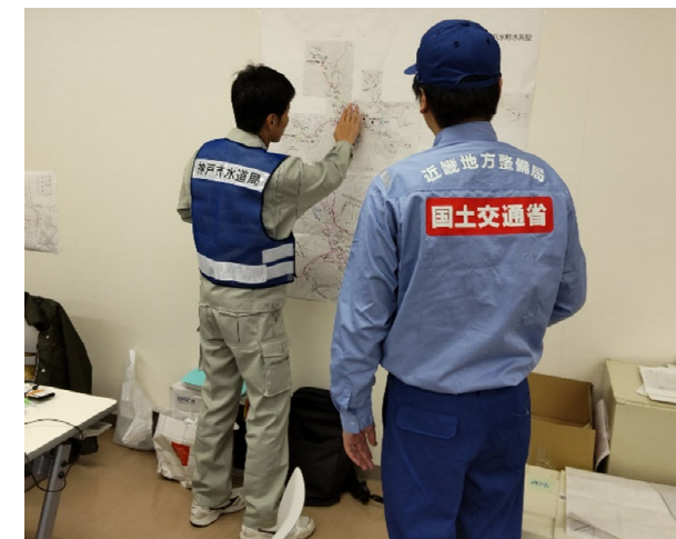
【水道班】金沢市 作業状況(23日)