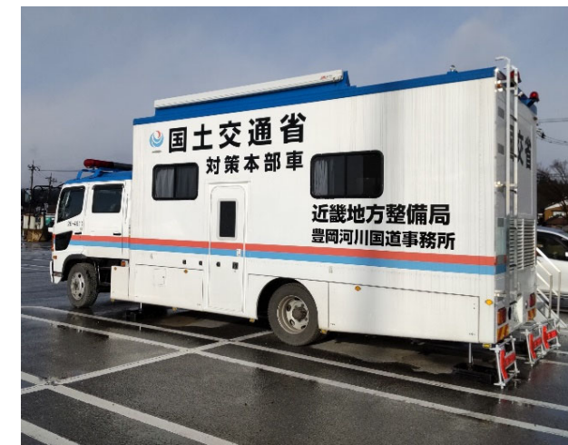
【対策本部車】輪島市 作業状況(23日)