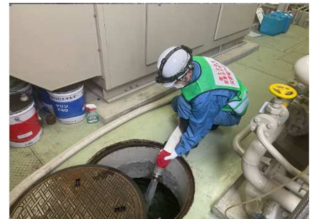
(珠洲市内で水道復旧支援・給水活動)