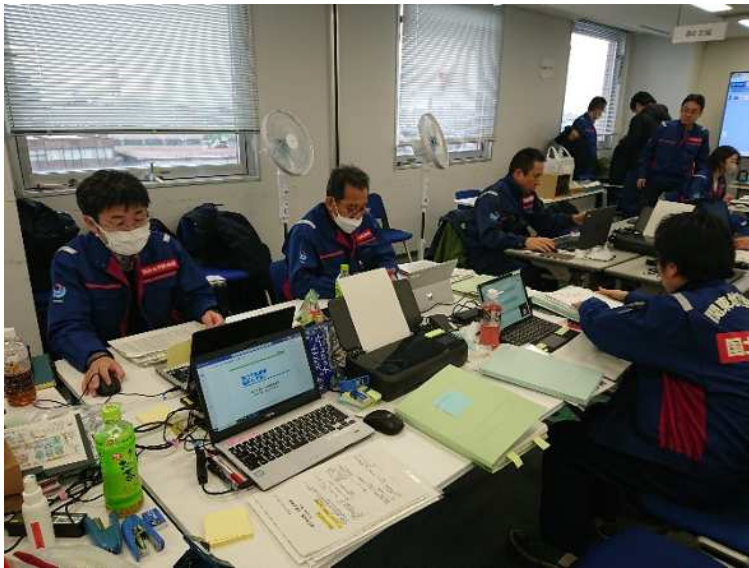
(北陸地方整備局での活動状況)