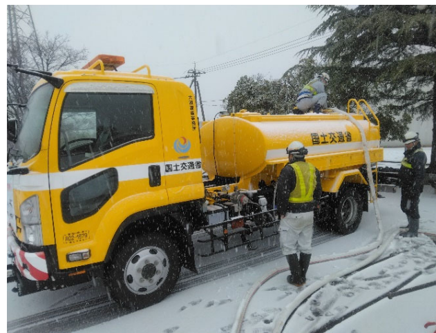
【給水班】金沢市他 作業状況(23日)