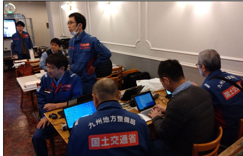
▲打ち合わせ状況（現地支援班）