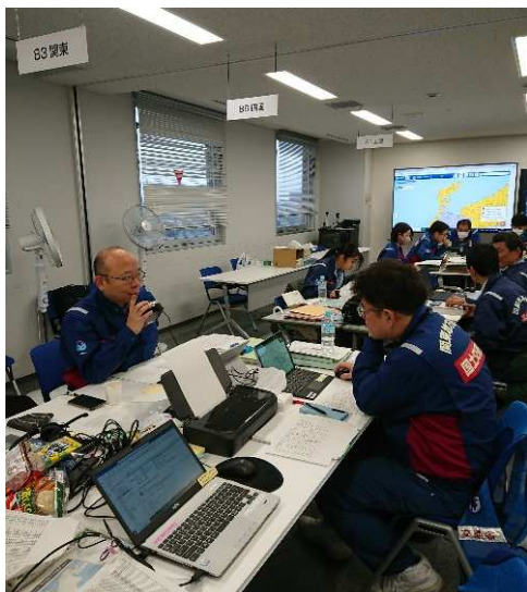
(北陸地方整備局での活動状況)