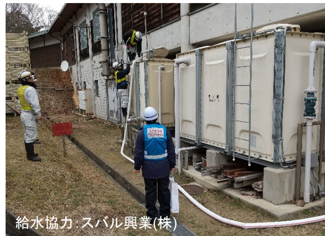
【給水班】能登町 給水作業（1日）