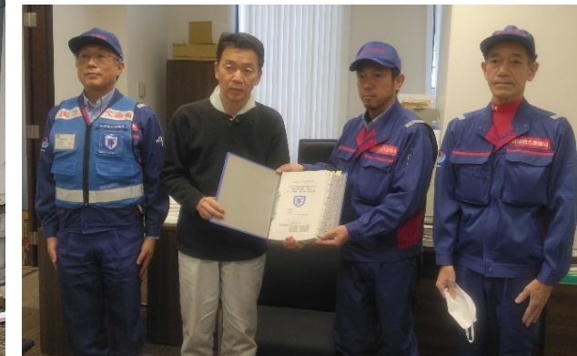
【砂防班】輪島市 報告書手交（1日）