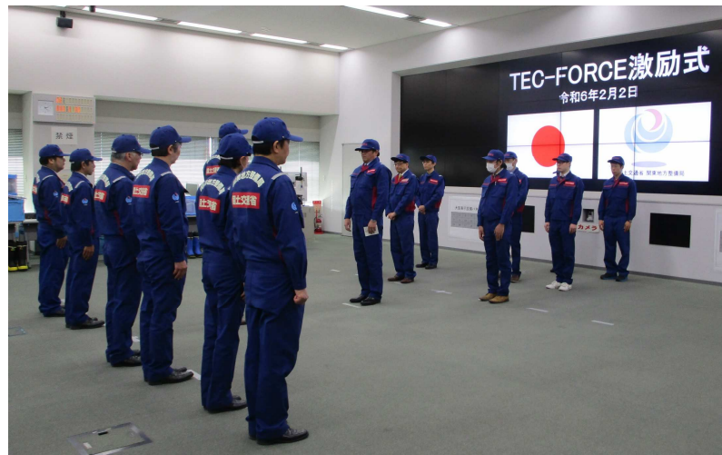
TEC-FORCE(緊急災害対策派遣隊)激励式

令和6年能登半島地震の被災自治体支援のため、2月5日(月)より、TEC-FORCE(緊急災害対策派遣隊)総合司令班・被害状況調査班等の交代要員11名を北陸地方整備局管内に派遣します。