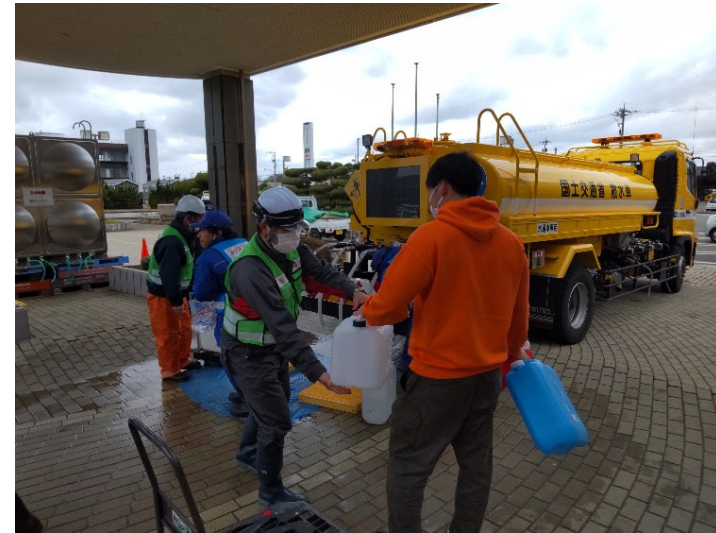
▲給水支援の状況（給水支援班）