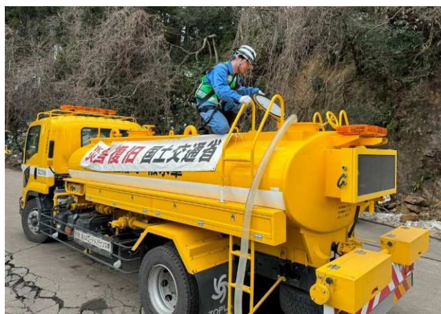
(珠洲市内での給水作業)