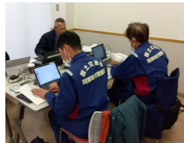
(被災状況とりまとめ作業)