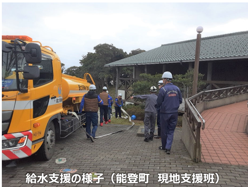
給水支援の様子（能登町 現地支援班）