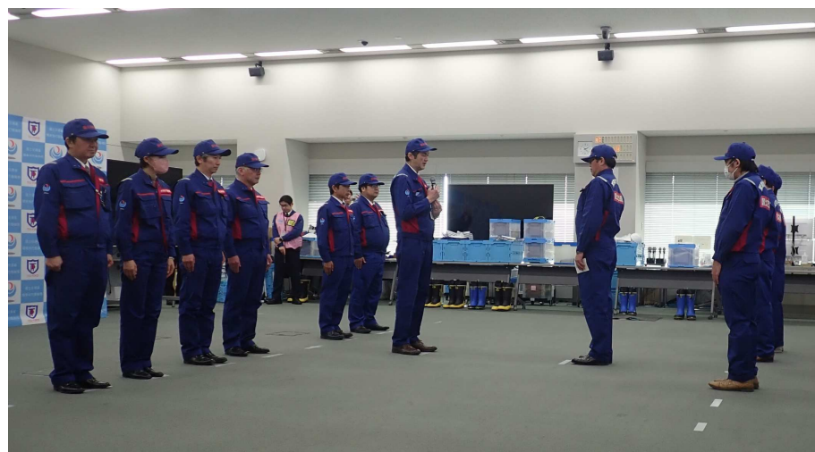
関東地方整備局長から激励