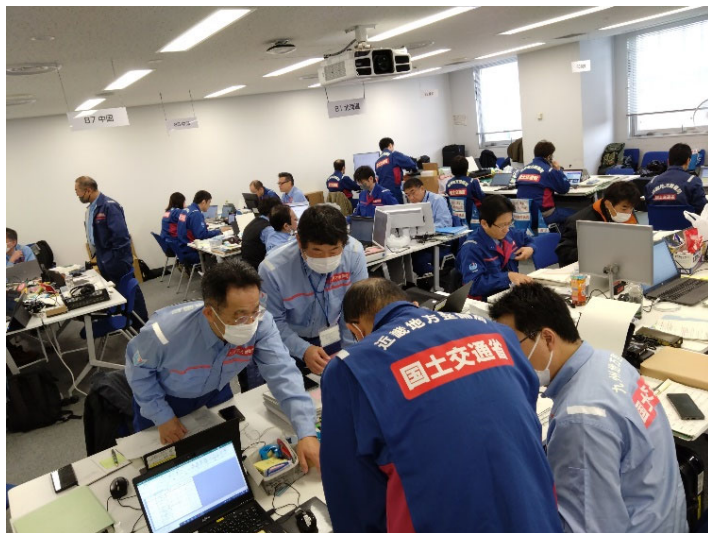
▲他地整との調整状況（先遣班）