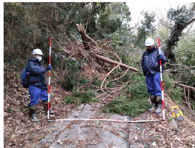
【道路班】珠洲市 被災調査（1日）