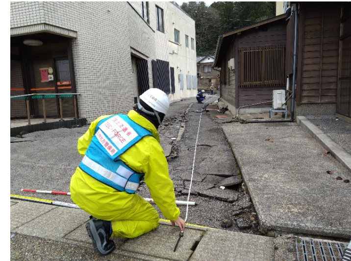
▲現地調査状況（被災状況調査班（道路））