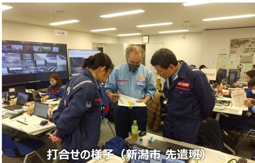
打合せの様子（新潟市 先遣班）

「TEC-FORCE派遣状況」 2月2日（金）10班・31名 のべ1,225・日（1/4～2/2）