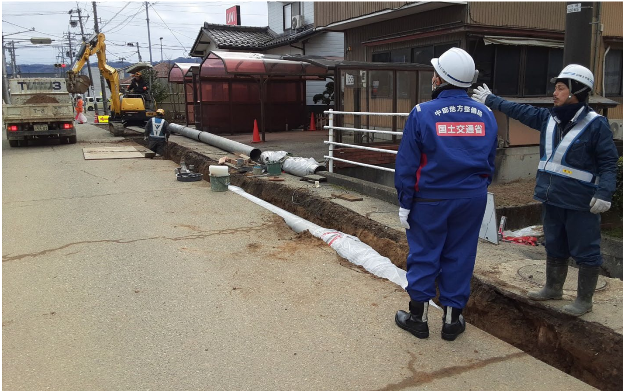
七尾市内の復旧工事確認【水道支援班】

本日（2月2日）の現地のTEC-FORCE（緊急災害対策派遣隊）の主な活動は以下のとおりです。