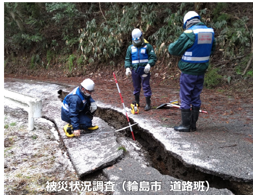
被災状況調査（輪島市 道路班）