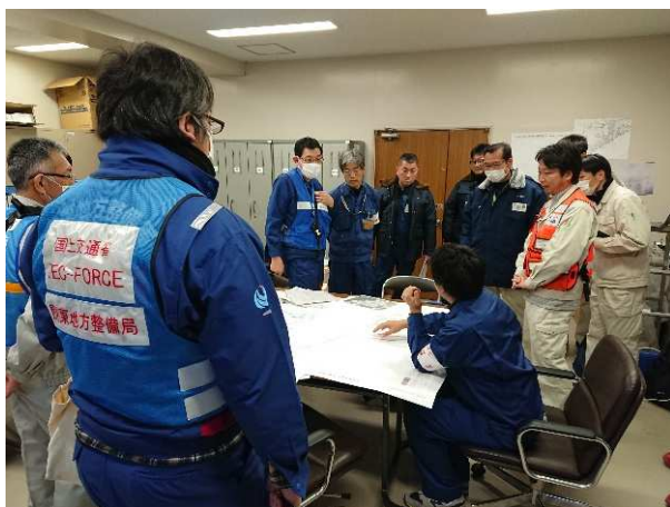
(珠洲市内での打ち合わせ)