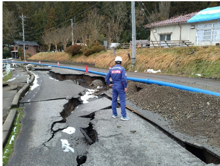
▲現地調査状況 （高度技術指導班（水道））