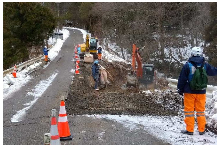
(能登町内での被災状況調査)