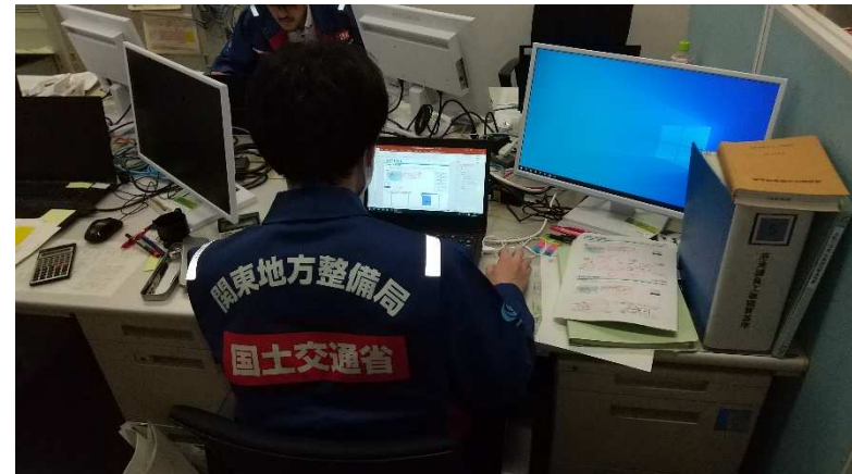
(北陸地方整備局にて資料作成)