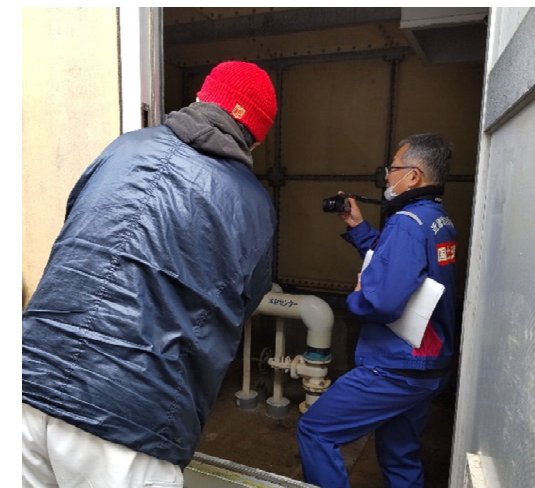
【水道班】穴水町 作業状況（9日）