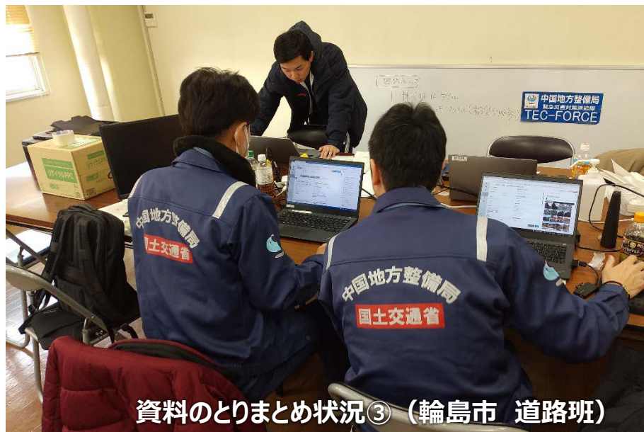
資料のとりまとめ状況③ (輪島市 道路班)