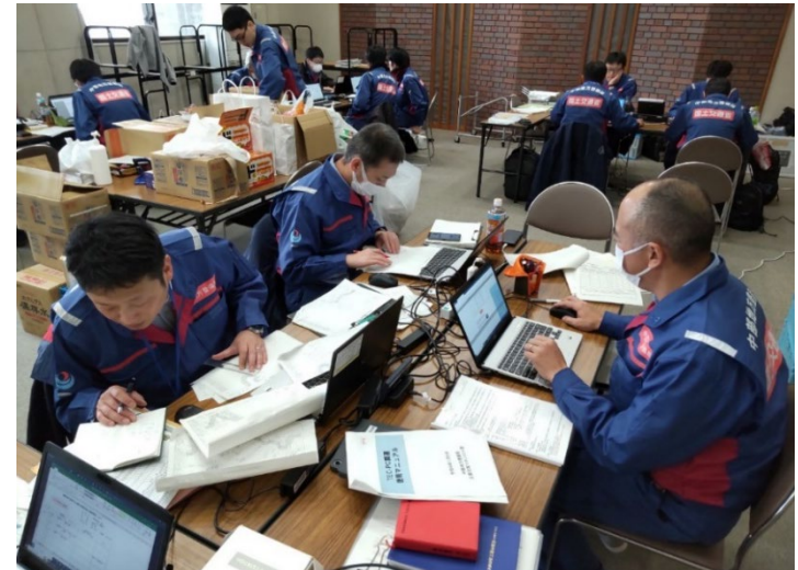
小矢部市内にて内業【道路班】