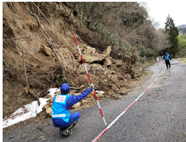
【道路班】輪島市 被災状況調査（9日）