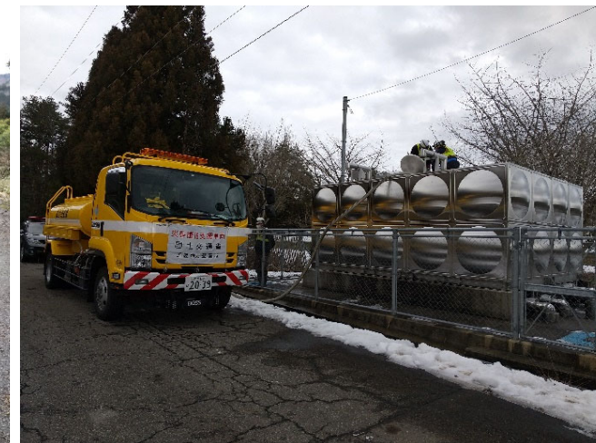
【給水班】能登町 作業状況（9日）