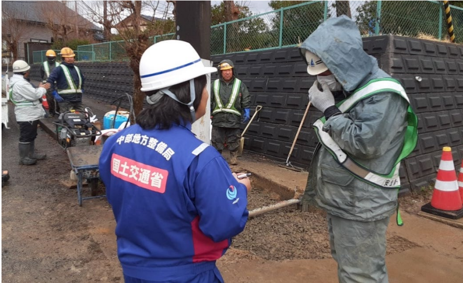
七尾市内にて現地調査【水道班】

本日（2月10日）の現地のTEC-FORCE（緊急災害対策派遣隊）の主な活動は以下のとおりです。