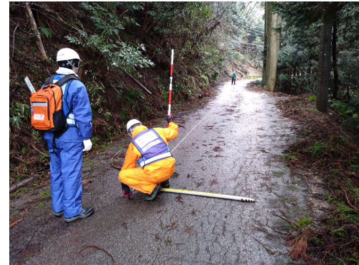
▲輪島市における道路の被災状況調査状況（被災状況調査班（道路））