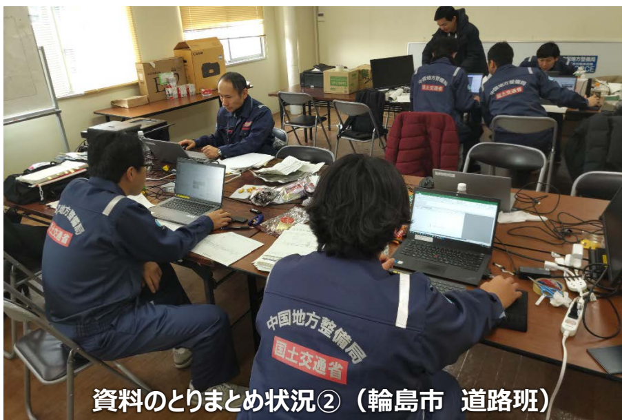
資料のとりまとめ状況② (輪島市 道路班)