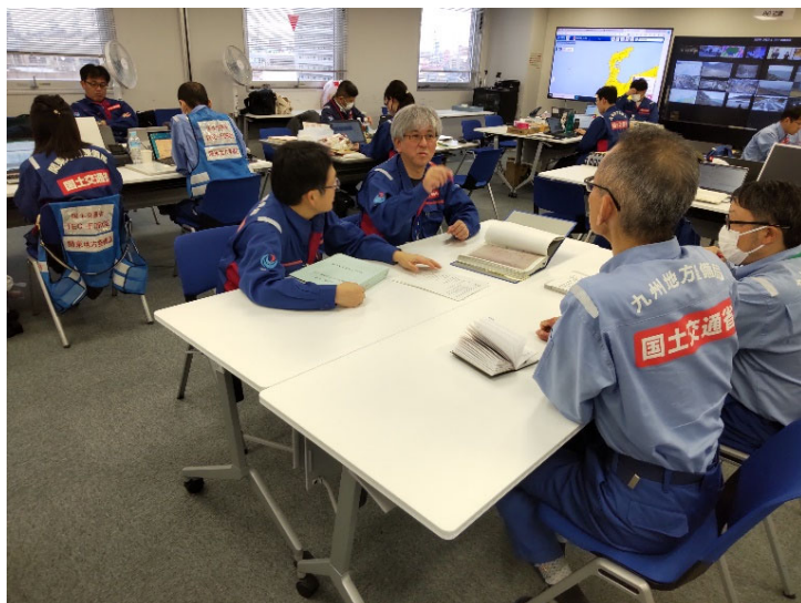
▲他地整との調整状況（先遣班）