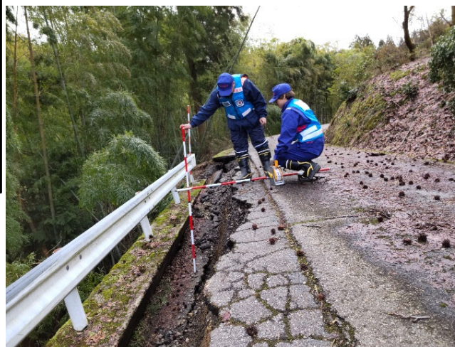
【道路班】輪島市 被災状況調査（9日）