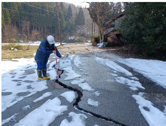
(能登町内での被災状況調査)