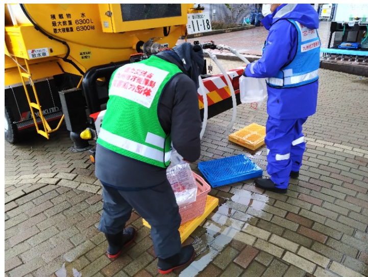
▲給水支援の状況（給水支援班）