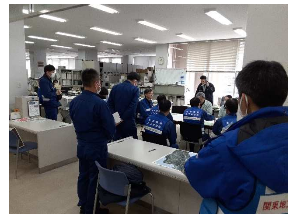
(珠洲市内での活動状況)