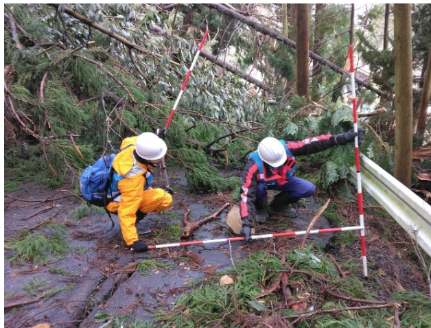
【道路班】輪島市 被災状況調査（10日）