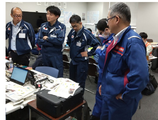
【水道班】金沢市 作業状況（10日）