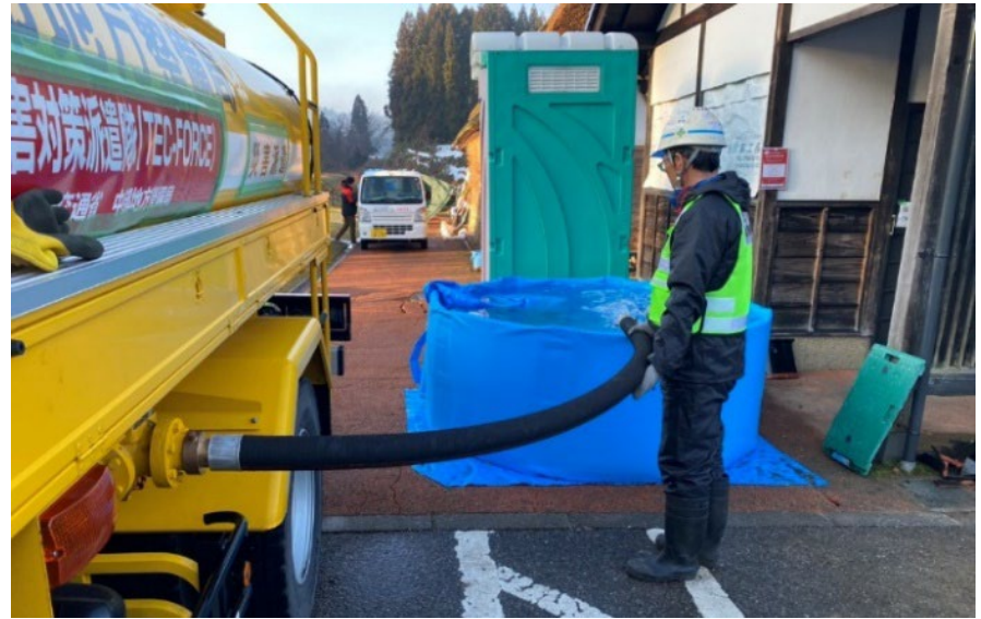
輪島市内にて補水【給水支援班】