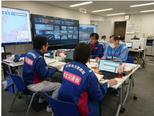
(北陸地方整備局での活動状況)