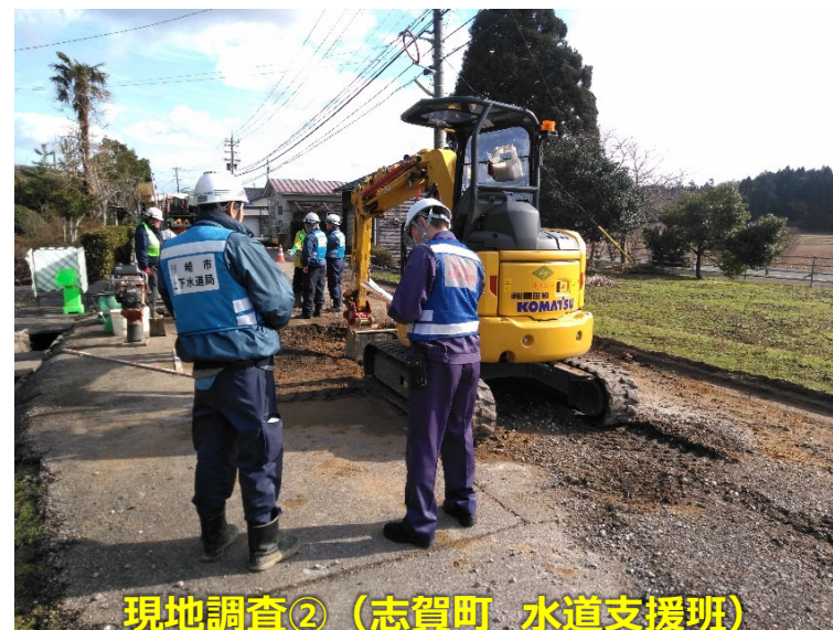
現地調査② (志賀町 水道支援班)