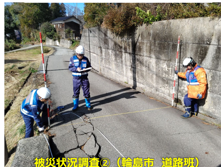
被災状況調査② (輪島市 道路班)