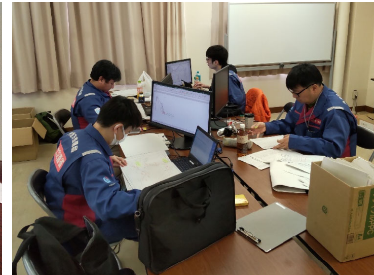
▲被災状況の資料整理状況（被災状況調査班（道路））