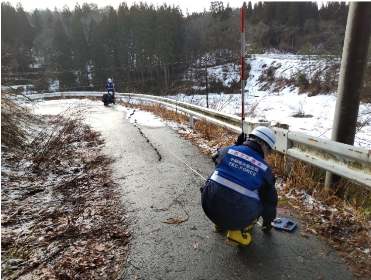
能登町内にて現地調査【道路班】

本日（2月11日）の現地のTEC-FORCE（緊急災害対策派遣隊）の主な活動は以下のとおりです。