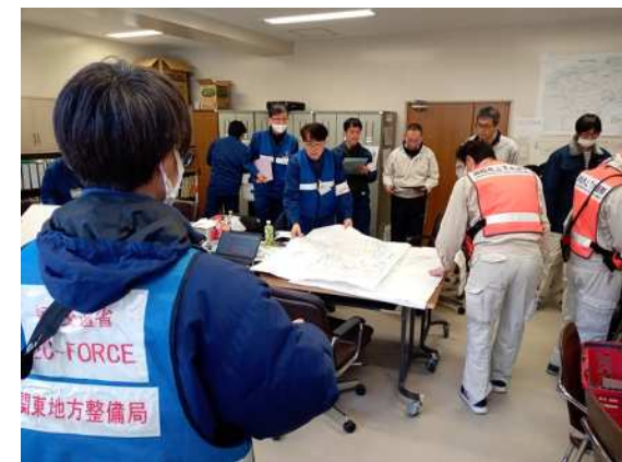
(珠洲市内での打合せ状況)