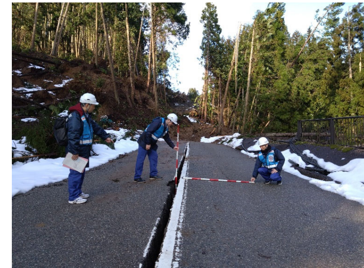
▲輪島市における道路の被災状況調査状況（被災状況調査班（道路））