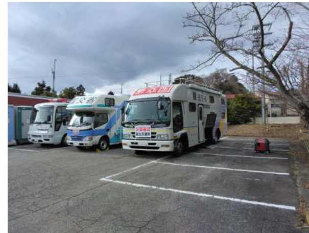
(能登町内での活動状況)