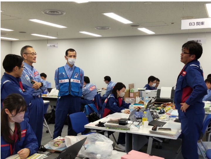
▲他地整との調整状況（先遣班）