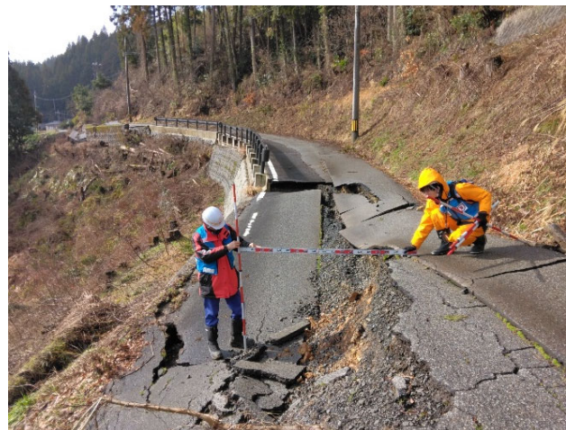
【道路班】輪島市 被災状況調査（10日）