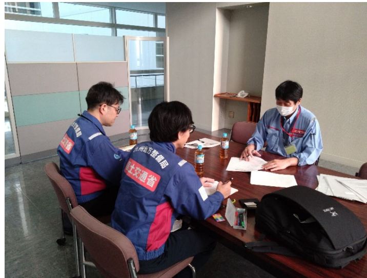
▲関係機関との調整状況（水道班）