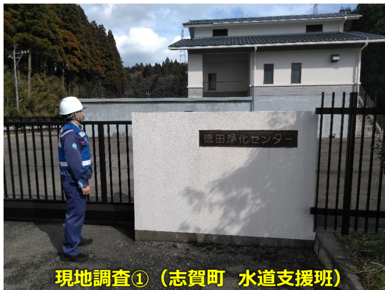
現地調査① (志賀町 水道支援班)

◀TEC-FORCE派遣状況▶ 2月11日(日) 6班・19名 のべ1,453人・日 (1/4~2/11)