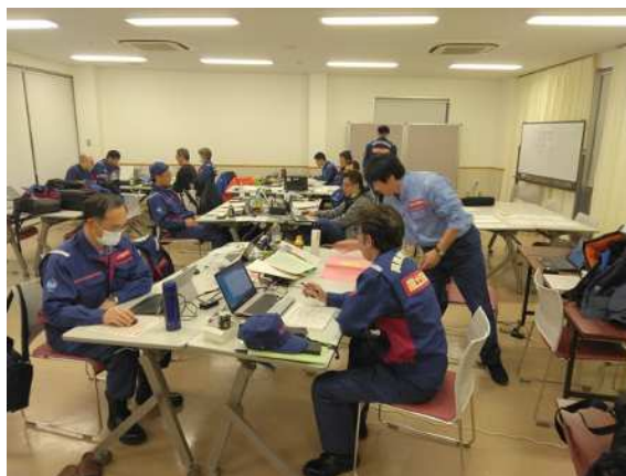
(活動拠点での資料作成状況)