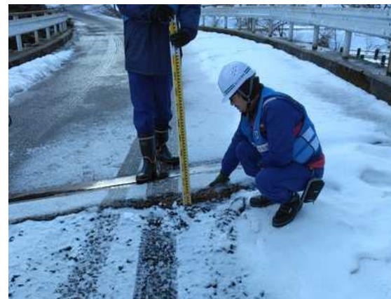
(能登町内での被災状況調査)