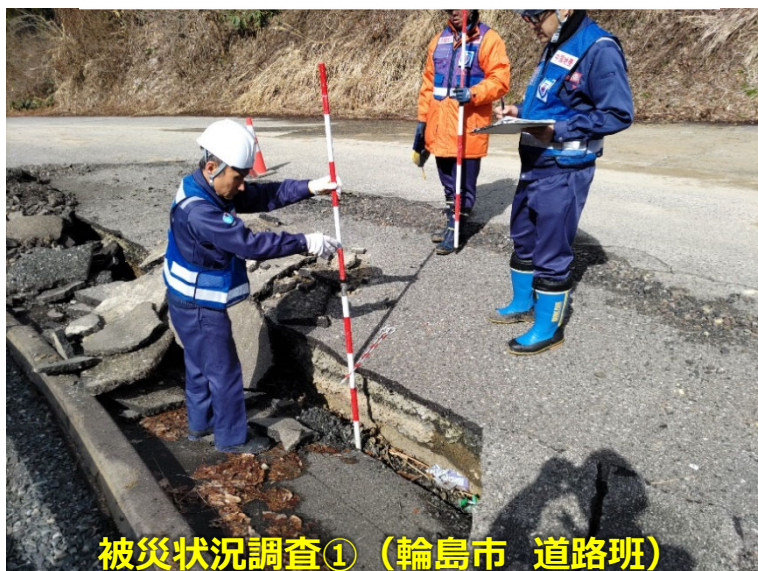
被災状況調査① (輪島市 道路班)