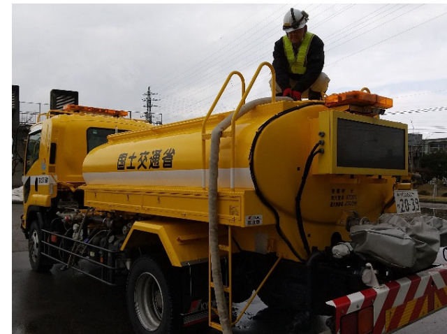
【給水班】金沢市 作業状況（10日）